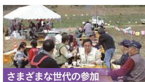
さまざまな世代の参加