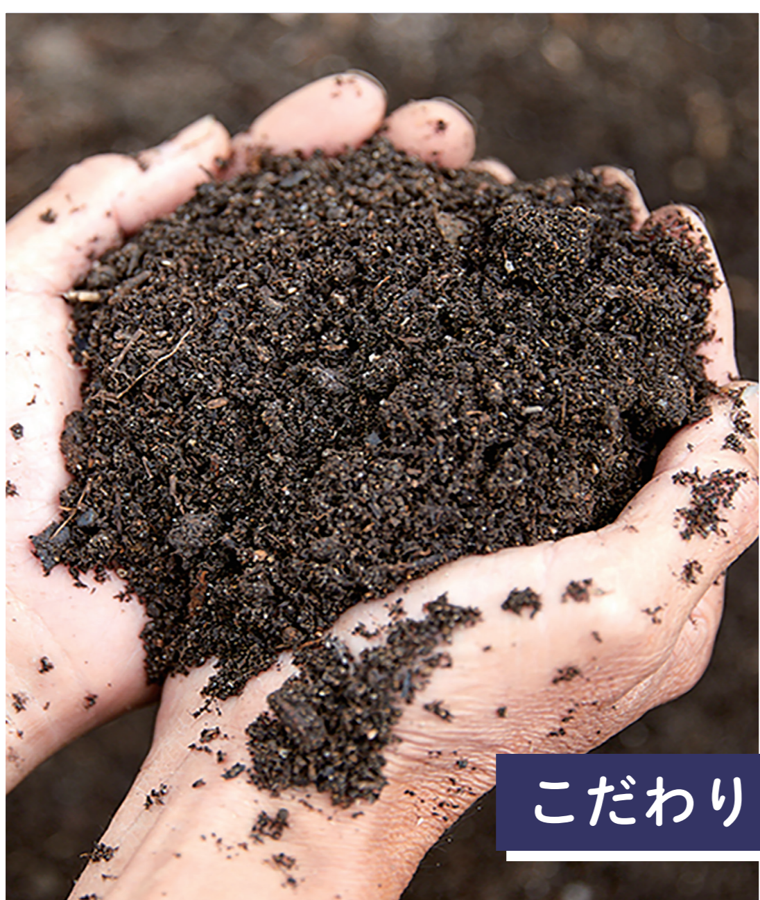
こだわりの土づくり